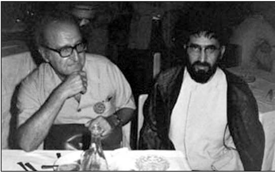
استاد سید هادی خسروشاهی و روژه گارودی در سیزدهمین کنفرانس اندیشه اسلامی در شهر تامنراست - الجزایر، سال ۱۳۵۵

سوسیالیسم در فرانسه، آیا امروز می توان یک کمونیست بود؟، در شناخت هگل، مارکسیست ها و مسیحیان، آزادی در تعلیق، نقطه عطف بزرگ سوسیالیسم.